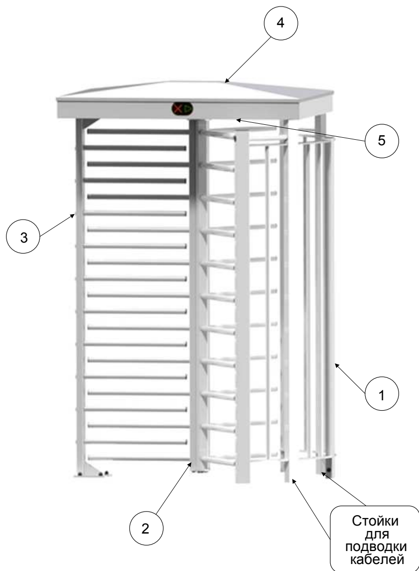
Рис. 1. Общий вид турникета.